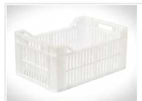
12 cajones (dim: 440 x 290 x 200 mm)