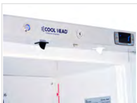
Alarma de apertura de puerta / alarma de temperatura alta