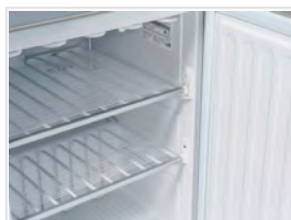
Rejilla de evaporador fijas