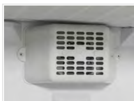
Ventilador interno de asistencia