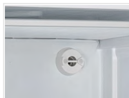
Válvula de presión para apertura fácil de puerta