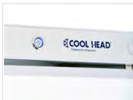
Interruptor principal retroiluminado (color azul)