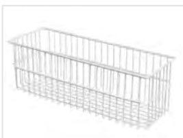
1 cajones inferiore (dim: 600 x 220 x 200 mm)