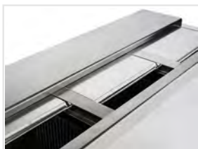
Puertas correderas en acero inoxidable con tirador