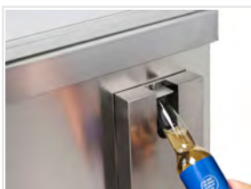
Abridor de botellas incluido