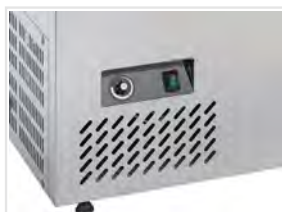
Interruptor principal independiente y regulador de temperatura